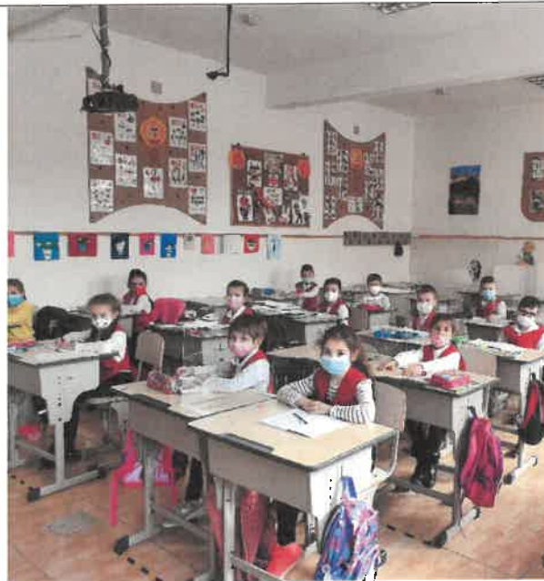
Figură 2 SALĂ DE CLASĂ