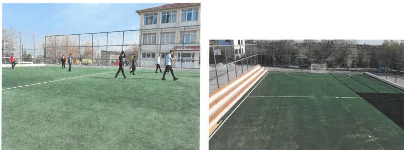
Figură 11 Teren de sport

Unitatea școlară dispune de sistem de supraveghere modern, cu 16 camere și senzori de mișcare. 15 săli, destinate susținerii examenelor naționale, sunt dotate cu camere de supraveghere video.