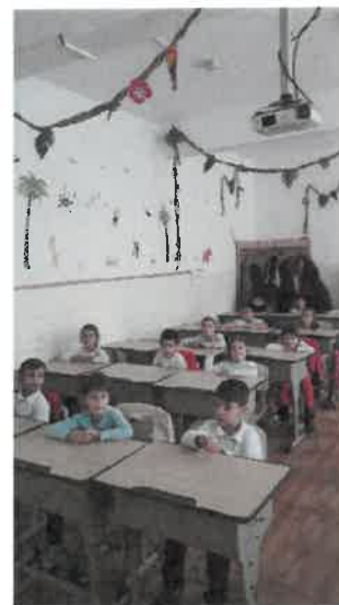
Figură 4 Clasa pregătitoare