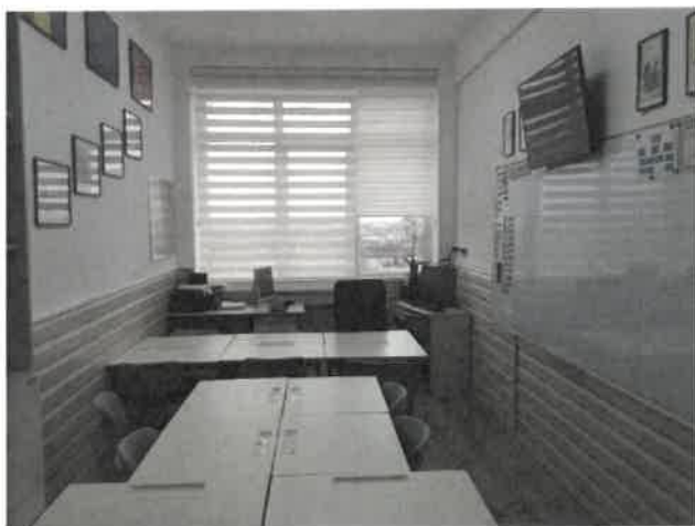
Figură 3 CABINETUL DE LIMBA MATERNĂ TURCĂ

Arhiva școlii și depozitul de materiale didactice.