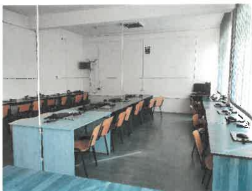
Figură 7 CABINET INFORMATICĂ/ TIC