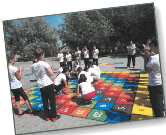
Figură 8 Curtea școlii