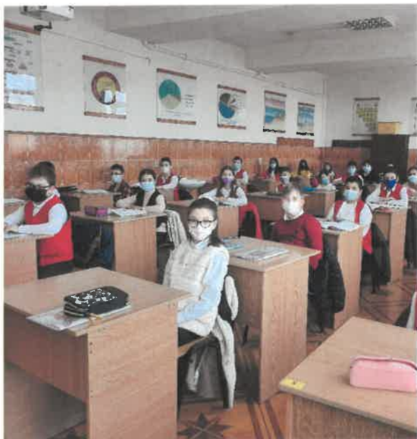
Figură 5 LABORATORUL DE CHIMIE-FIZICĂ

Tel. / Fax.: 0241/822 044, email: scgrigorescumedg@yahoo.com , https://scoalaluciangrigorescu.ro