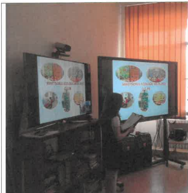
Figură 1 SALA C.O.R.A.L.