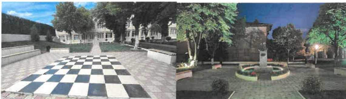
Figură 10 PARCUL ȘCOLII

Tel. / Fax.: 0241/822 044, email: scgrigorescumedg@yahoo.com , https://scoalaluciangrigorescu.ro