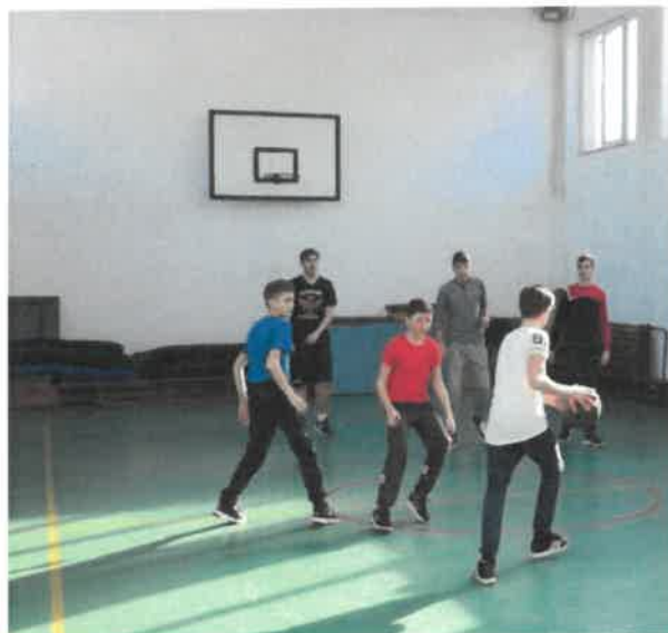
Figură 6 SALA DE SPORT