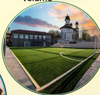
Sală de sport și teren multifuncțional; Teren de baschet