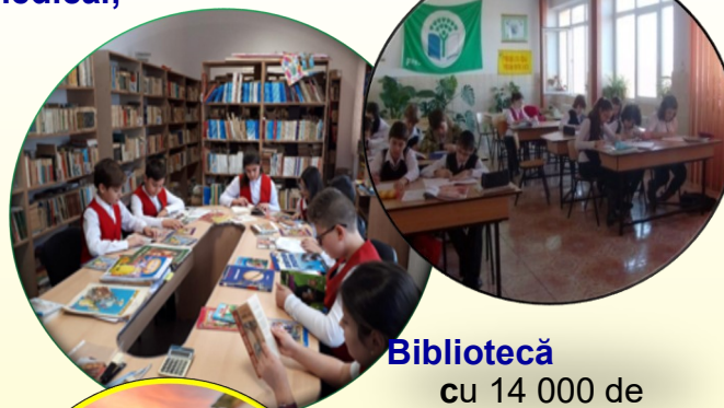
Bibliotecă cu 14 000 de volum

Laboratoare de biologie și de fizică - chimie dotate cu videoproiectoare, calculatoare conectate la Internet și table inteligente, Ca- binet de lb. turcă ultramodern; Cabinet me- todologic; Cabinet medical;