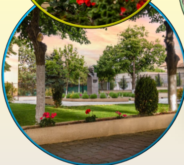
Parcul școlii ultramodern; Sistem video de supraveghere.